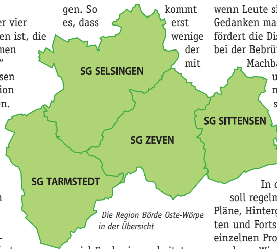
Die Region Börde Oste-Wörpe in der Übersicht