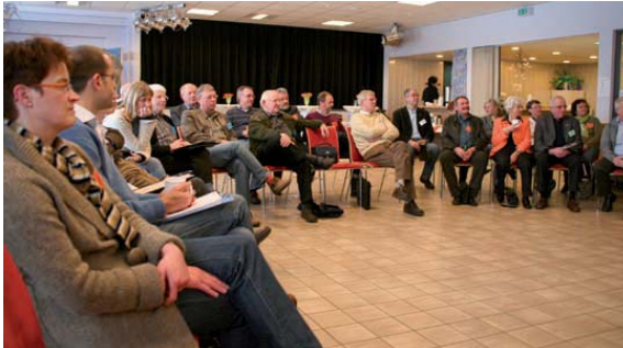
Vor versammelter Runde präsentierten die Gruppen Ideen zur Nachbarschaftshilfe

Waren es auch unterschiedliche Stichworte, die die vier Samtgemeinden der Börde Oste-Wörpe am Ende präsentierten – es wurden doch viele ähnliche Entwicklungen im Miteinander und in den Ehrenämtern herausgearbeitet. Bei allen vier Gruppen wurde die Situation so eingeschätzt, dass es in den ganz kleinen Dörfern „noch gut läuft“ in Sachen Nachbarschaftshilfe und Ehrenamt.